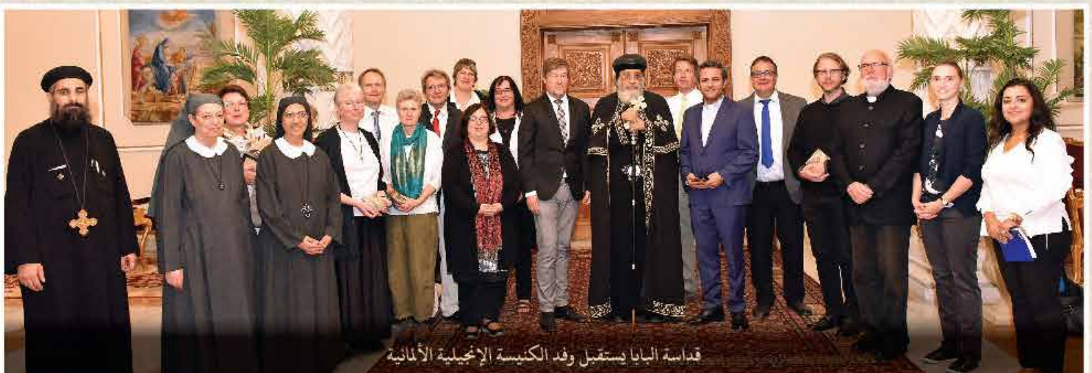
قداسة البابا يستقبل وفد الكنيسة الإخيلية الألمانية