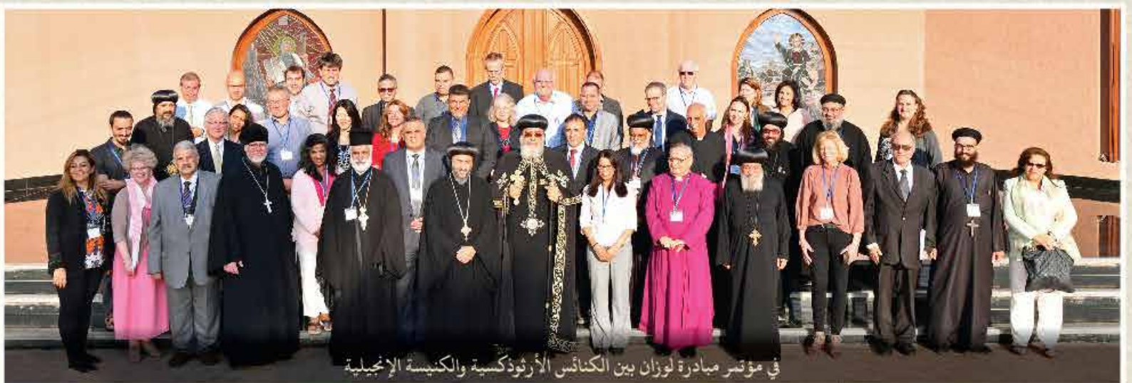
في مؤتمر مبادرة لوزان بين الكنائس الأرثوذكسية والكنيسة الإنجيلية