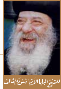
الشيخ البابا الأنبا شنودة الثالث

مجلة الكرازة ٢٩ ديسمبر ٢٠٠٦ - العددان ٣٥-٣٦