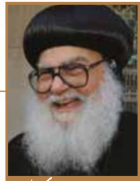
نيافة (الأنبا موسى) أسقف عام لشباب