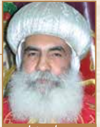
زيارة الأنبا بنامين مطار المنوفية

هي سر قوتهم ونصرتهم على عدو الخير. بل هي دليل الإخلاص القلبي والود الحقيقي بين الإنسان والله كعروس للمسيح. فصراحة الحديث وصدق التعبير وقوة التأثير ودوام فيض المشاعر بلا توقف... الخ.