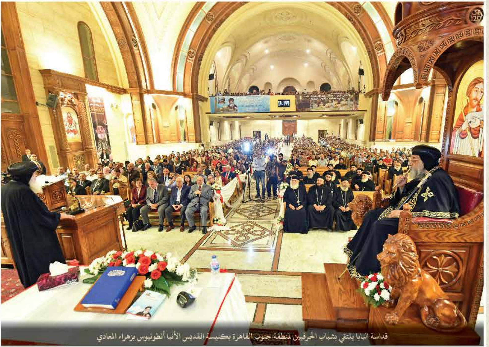
قداسة البابا يلتقي بشباب الحرفيين لمنطقة جنوب القاهرة بكنيسة القديس الأنبا أنطونيوس بزهره المعادي