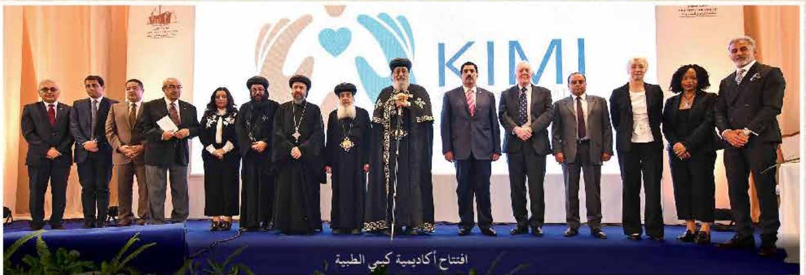
افتتاح أكاديمية كيمي الطبية