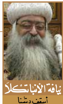
نيافة الأنبا تكلا أسقف دشنا

فقد علمنا السيد المسيح كيف نلتمس الأعداء لضعفات الناس وخطاياهم وأفعالهم التي تبدو خاطئة ولا ندينهم. وأطنا مثلاً لذلك عندما نام التلاميذ وتركوه وحده في وقت آلامه وأحزانه في بستان جشيمانى فقال: «أما الروح فنشيط وأما الجسد فضعيف» (متى ٢٦: ٤١)، «يا أبتاه اغفر