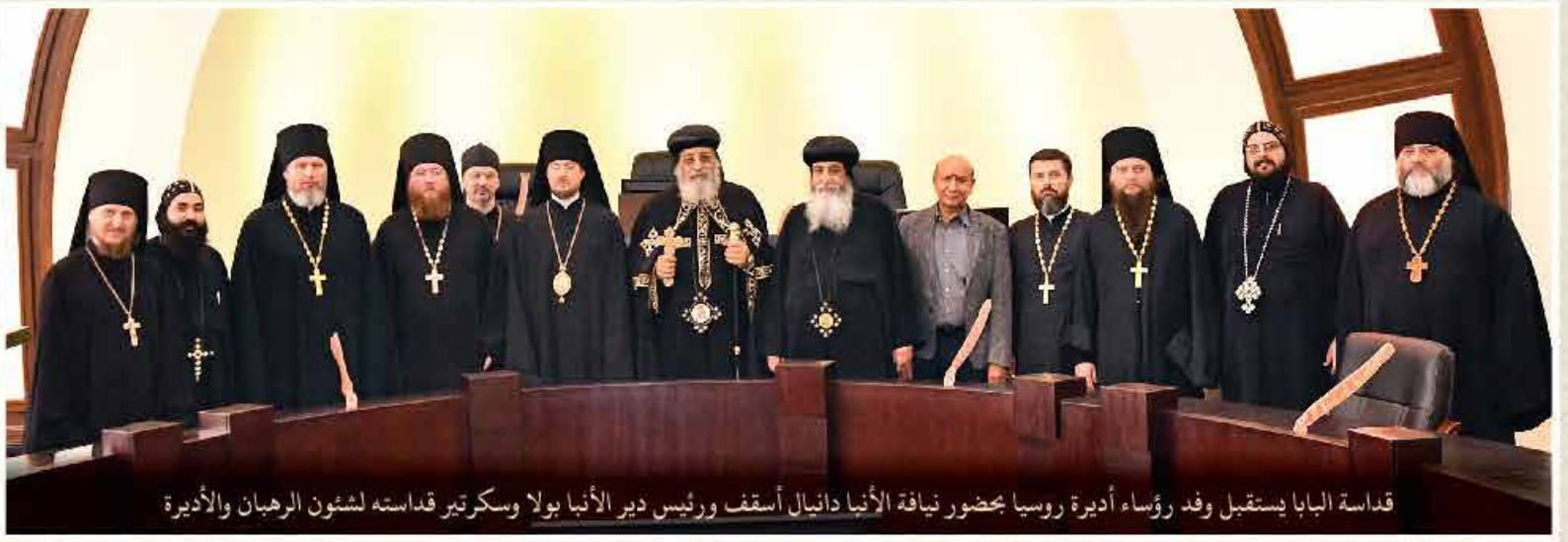
قداسة البابا يستقبل وفد رؤساء أديرة روسيا بحضور نيافة الأنبا دانيال أسقف ورئيس دير الأنبا بولا وسكرتير قداسته لشئون الرهبان والأديرة