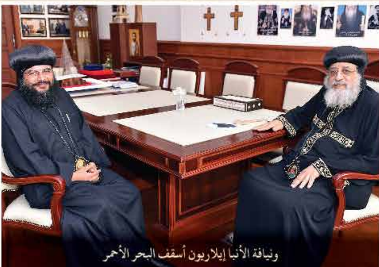
ونيافة الأنبا إيلاريون أسقف البحر الأحمر