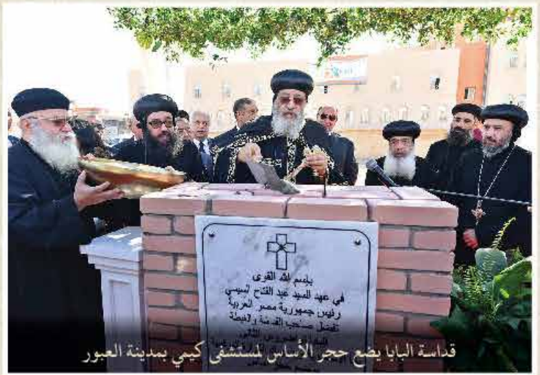
قداسة البابا يضع حجر الأساس للمستشفى كيمي بمدينة العجور