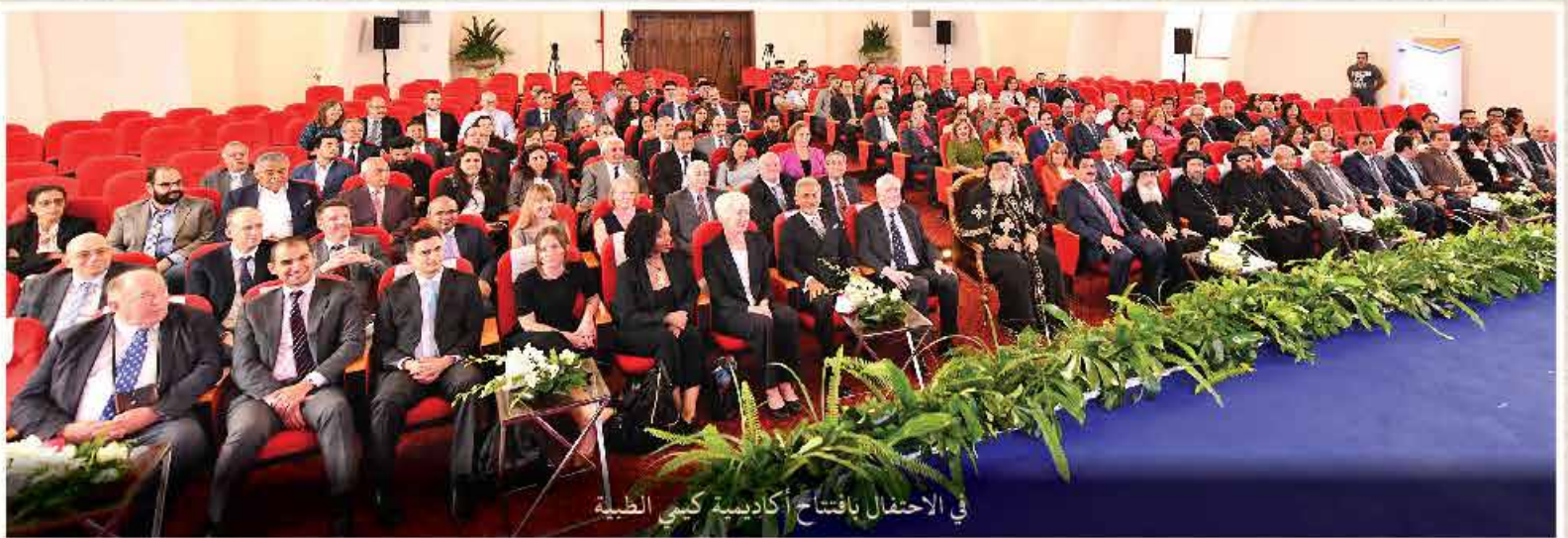
في الاحتفال بافتتاح أكاديمية كيمي الطبية