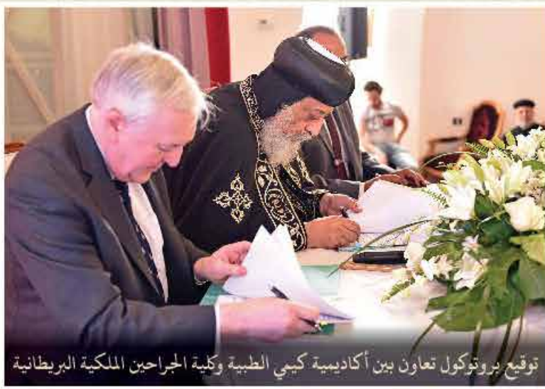
توقيع بروتوكول تعاون بين أكاديمية كيمي الطبية وكلية الجراحين الملكية البريطانية