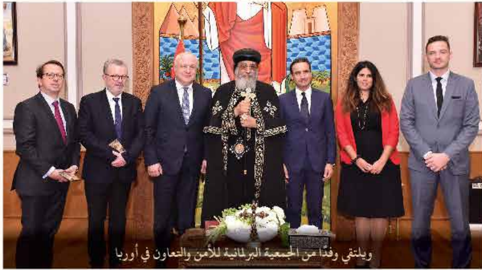
ويلتقي وفداً من الجمعية البرلمانية للأمن والتعاون في أوربا